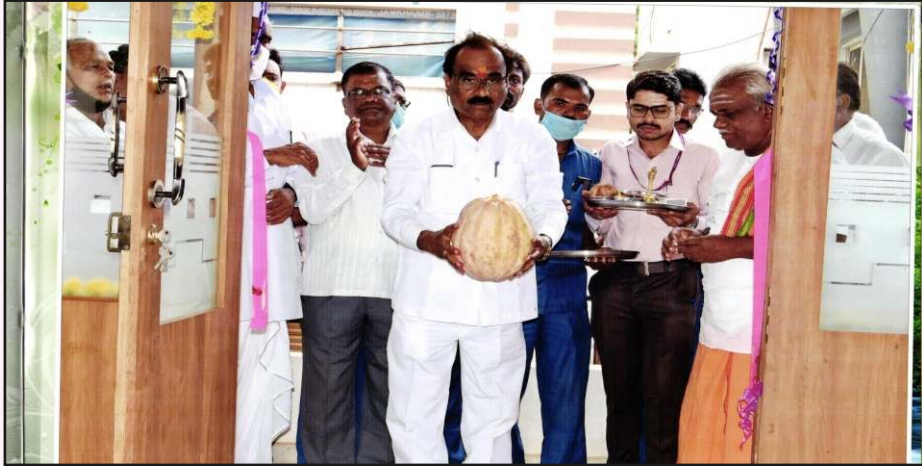
ನೋಂದಾಯಿತ ಕಛೇರಿಯ ಆಡಳಿತ ವಿಭಾಗದ ಹೊಸ ಕೊಠಡಿ ಉದ್ಘಾಟನಾ ಸಮಾರಂಭ