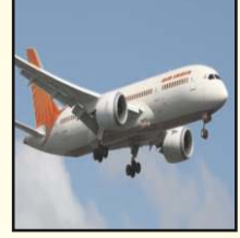
ವಿಮಾನ ಟಿಕೆಟ್ ಬುಕ್ಯಿಂಗ್