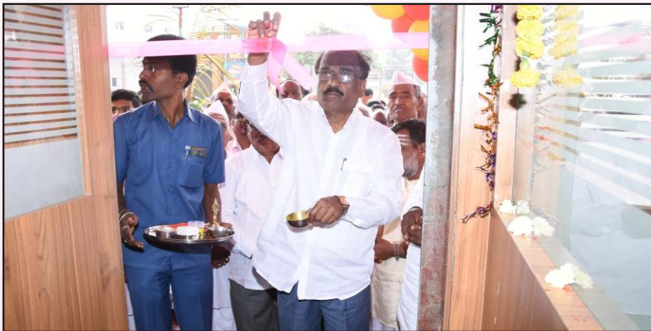
ಕುಡಚಿ ರೋಡ್, ಜಮಖಂಡಿ ಹೊಸ ಶಾಖೆಯ ಉದ್ಘಾಟನಾ ಸಮಾರಂಭ