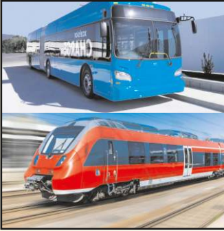
ರೈಲ್ವೆ ಮತ್ತು ಬಸ್ ಟಿಕೆಟ್ ಬುಕ್ಯಿಂಗ್