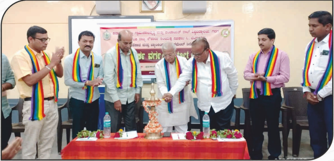
ಸಂಯುಕ್ತ ಸಹಕಾರಿಯು ಆಯೋಜಿಸಿರುವ ಡಿ.ಸಿ.ಬಿ.ಎಮ್. 2023-24 ರ ಸಂಪರ್ಕ ವರ್ಗದ ಉದ್ಘಾಟನಾ ಸಮಾರಂಭ

ನೋಂದಾಯಿತ ಕಛೇರಿ: ಪೋಸ್ಟ್-ತಾಲೂಕು: ಜಮಖಂಡಿ-587301 ಜಿ: ಬಾಗಲಕೋಟೆ