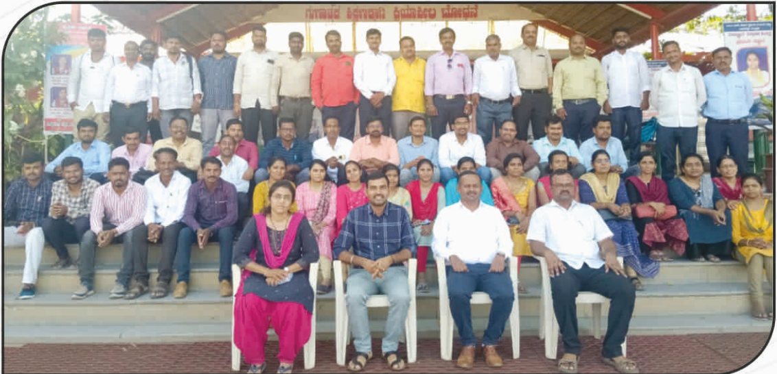
2023-24 ನೇ ಸಾಲಿನ ಡಿ.ಸಿ.ಬಿ.ಎಮ್. ಕೋರ್ಸನ ಸಂಪರ್ಕ ವರ್ಗದ ಶಿಬಿರಾರ್ಥಿಗಳ ಜೊತೆ ಅಧಿಕಾರಿ ಹಾಗೂ ಸಿಬ್ಬಂದಿಗಳು