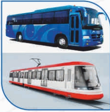
ರೈಲ್ವೆ & ಬಸ್ ಟಿಕೆಟ್ ಬುಕ್ಕಿಂಗ್