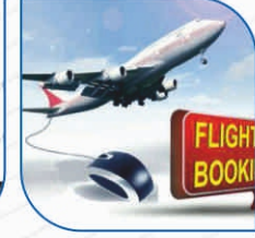
ವಿಮಾನ ಟಿಕೆಟ್ ಬುಕ್ಕಿಂಗ್