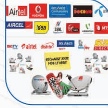
ಮೊಬೈಲ್ & ಡಿಟಿಎಚ್ ರಿಚಾರ್ಜ್